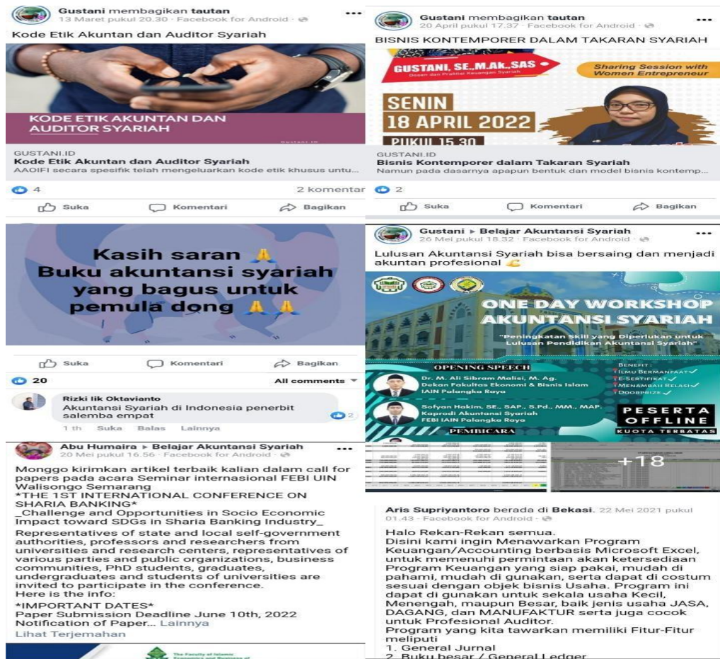
Gambar 2. Diskusi Antar Anggota Grup Facebook "Belajar Akuntansi Syariah" Mengenai Pertukaran Ilmu Akuntansi Syariah