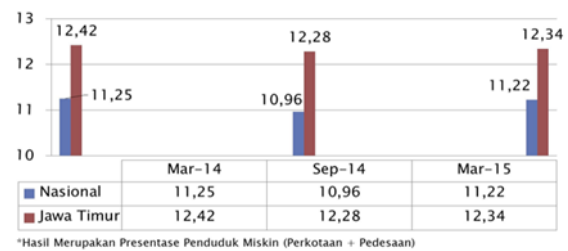
Gambar 2. Presentase Penduduk Miskin Jawa Timur dan Nasional

penduduk miskin Jawa Timur lebih besar dari persentase penduduk miskin nasional.