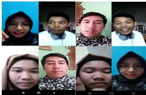
Gambar 3. Pendampingan Materi melalui Video Call WA

Pada tahap pertama, peserta diberikan pelatihan penggunaan pemanfaatan dan penggunaan Ms.Excell untuk membuat buku kas untuk berbagai unit usaha. Sebelum dan sesudah mengikuti pelatihan ini setiap peserta diminta untuk menjawab pertanyaan-pertanyaan terkait pemahaman penggunaan Microsoft Excel. Tabel 3 menyajikan respon peserta pelatihan sebelum dan sesudah mengikuti pelatihan.