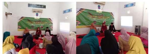
Gambar 3. Program Pendampingan melalui Workshop kepada Komunitas Ibu RT Dusun Preng Ampel Pamekasan

Peran perempuan sebagai hasil dari pengabdian kepada masyarakat digambarkan sebagai gambar 4.