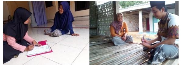
Gambar 2. Survei Ke Komunitas Ibu RT Preng Ampel Pamekasan