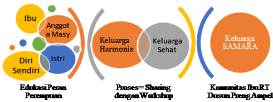
Gambar 4. Proses pendampingan komunitas ibu rumah tangga yang menikah usia dini di dusun preng ampel pamekasan