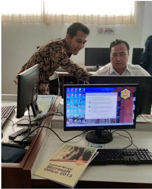
Gambar 4. Modul dan cara pemdampingan

Dalam kegiatan pengabdian masyarakat seperti terlihat pada gambar 3 yakni bagaimana dosen sebagai pelaksana pengabdian masyarakat memberikan arahan langsung kepada pesertanya. Kemudian materi yang diberikan semua telah ada pada modul sehingga jika peserta telah selesai mengikuti pengabdian masyarakat ini dapat mengulang materi kembali hanya dengan membuka modul tersebut.