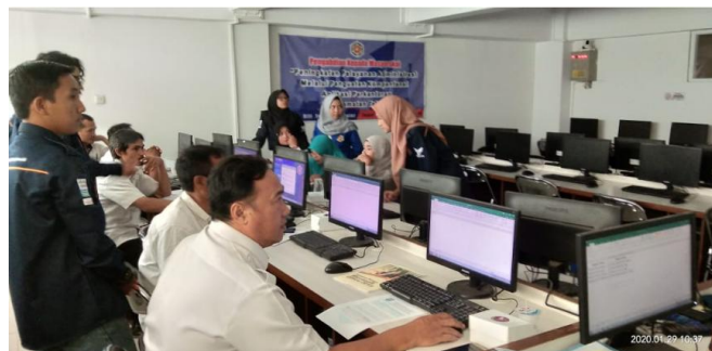
Gambar3. pendampingan peserta pengabdian oleh mahasiswa

Dalam kegiatan pelatihan diperlukan pendampingan supaya peserta benar-benar paham dalam mengaplikasikan materi. Yaitu dengan praktek dibimbing sampai menyelesaikan suatu project.