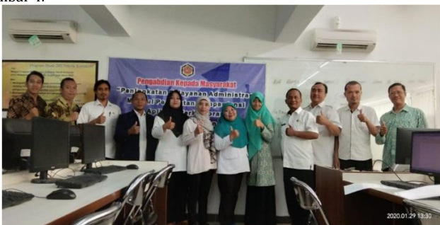
Gambar4. dokumentasi kegiatan

Setelah acara selesai dilakukan foto bersama sebagai bentuk dokumentasi kegiatan pelaksanaan pengabdian masyarakat ini seperti terlihat pada gambar 4.