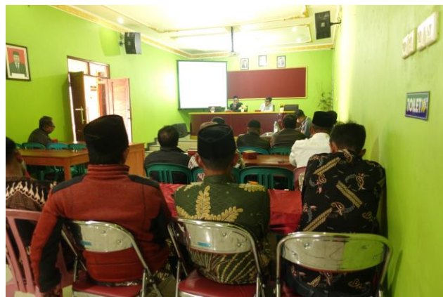
Gambar 2. Musyawarah desa bersama dengan Kepala Desa Pogalan dan tokoh masyarakat.

Salah satu infrastruktur jalan yang akan ditingkatkan yaitu jalan untuk menuju ke makam Desa Pogalan yang terletak di Dusun Derpan. Jalan tersebut saat ini kondisinya masih berupa tanah sehingga pada saat hujan jalan menjadi sangat licin. Kondisi jalan menuju makam Desa Pogalan seperti yang ditunjukkan pada Gambar 3.