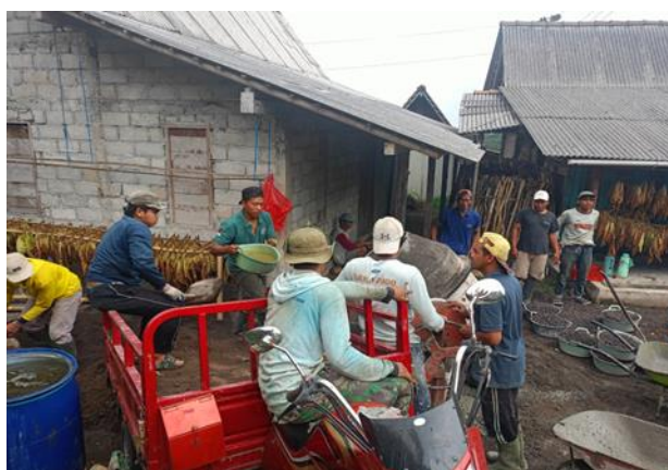
Gambar 6. Pekerjaan pencampuran beton dengan menggunakan molen.