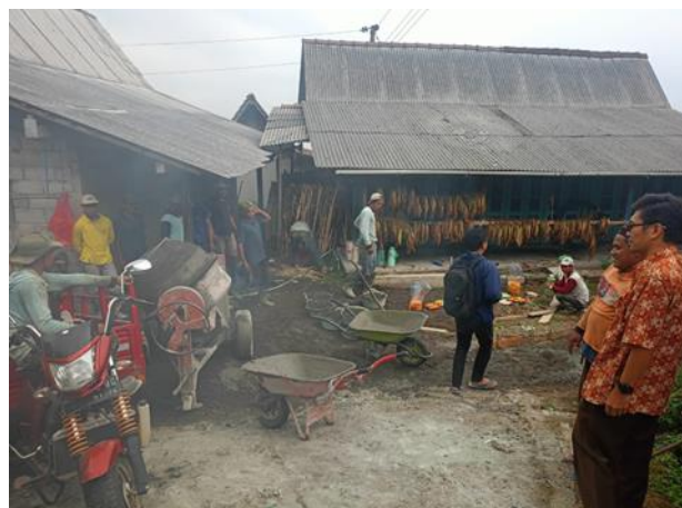
Gambar 5. Pekerjaan persiapan alat dan material pengecoran jalan di Desa Pogalan.

Pelaksanaan kegiatan pengecoran jalan menuju makam Desa Pogalan yang terletak di Dusun Derpan yang diawali dari persiapan alat dan material, pencampuran beton, pemasangan benang, pemasangan papan bekesting, penuangan beton, dan perataan beton ditunjukkan pada Gambar 5 sampai dengan Gambar 12 berikut ini.