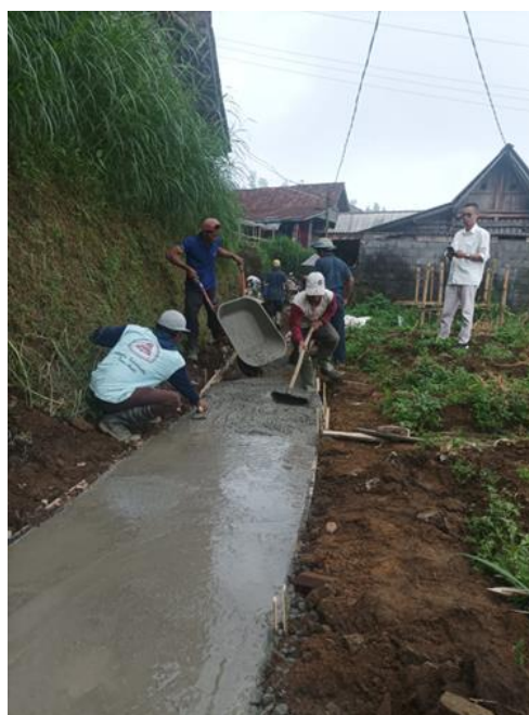
Gambar 11. Pekerjaan penghamparan beton dan perataan permukaan jalan.