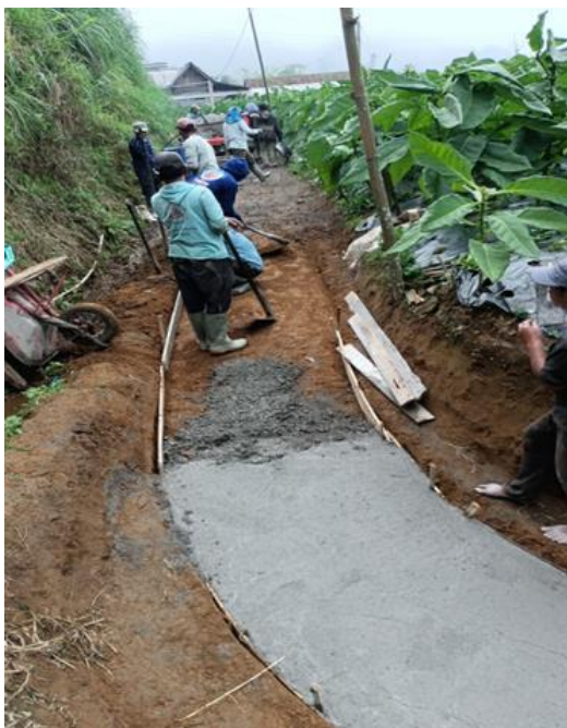
Gambar 8. Pekerjaan pemasangan papan bekesting untuk batas kanan dan kiri area yang dicor.