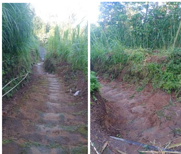
Gambar 3. Kondisi jalan menuju makam Desa Pogalan

Salah satu pendekatan dalam pemberdayaan masyarakat adalah Participatory Rural Appraisal (PRA). PRA merupakan sebuah pendekatan yang memungkinkan masyarakat secara bersama-sama melakukan analisis terhadap masalah yang dihadapinya dengan cara merumuskan perencanaan dan kebijakan secara mandiri (Sulaeman et al., 2023). Metode yang digunakan dalam kegiatan pengabdian kepada masyarakat yaitu Participatory Rural Appraisal (PRA). Pendekatan ini berfokus pada pelibatan masyarakat untuk memahami realitas sosial dan kebutuhan lokal, dengan menggunakan alat pemetaan untuk mempermudah partisipasi (Lestari et al., 2020).