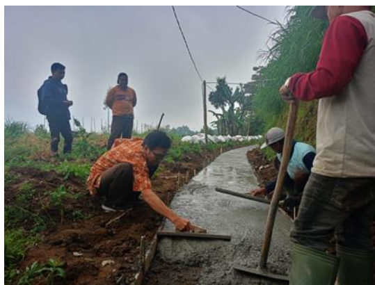
Gambar 10. Kegiatan perataan beton.