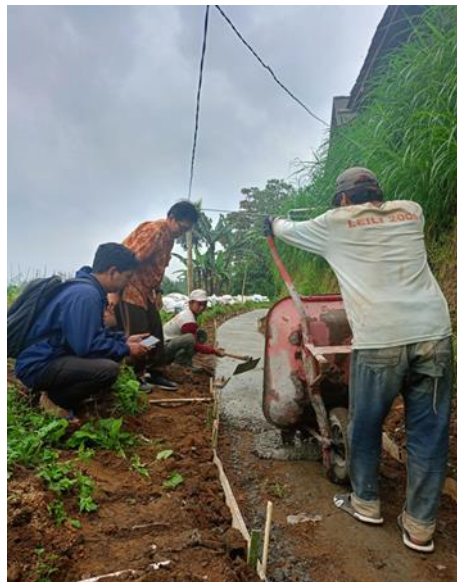
Gambar 9. Pekerjaan penuangan campuran adukan beton dengan gerobak dorong.