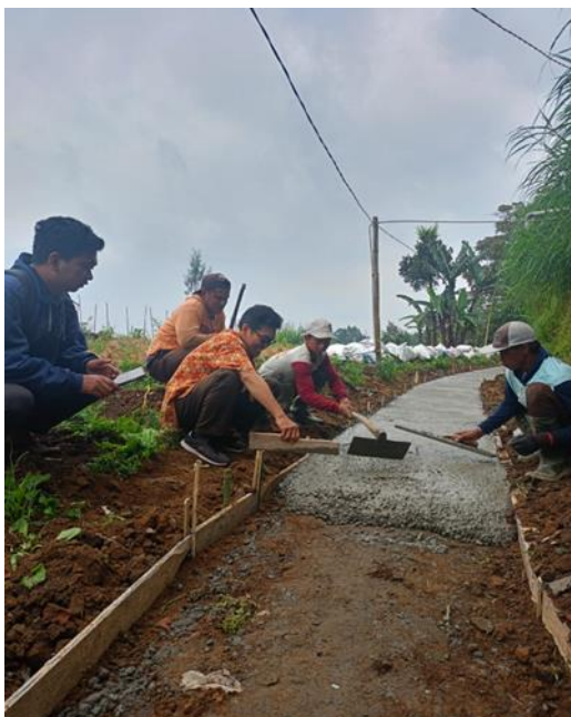
Gambar 12. Pekerjaan perataan beton dan pepadatan perkerasan beton.