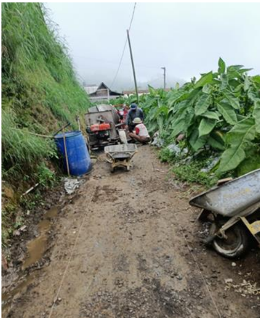
Gambar 7. Pekerjaan pemasangan benang sebagai batas area yang akan dicor.