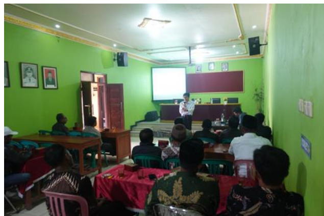
Gambar 4. Penyampaian materi oleh Tim Pengabdi.

Kegiatan edukasi yang dilakukan yaitu tentang teknologi beton dan perkerasan kaku. Edukasi dilakukan dengan cara berdiskusi dan tanya jawab tentang teknologi beton untuk perkerasan jalan meliputi bahan-bahan material penyusun beton, perancangan campuran beton (mix-design), jenis-jenis campuran beton, dan pembuatan beton dengan mutu tertentu. Kegiatan edukasi dilakukan untuk meningkatkan pengetahuan masyarakat khalayak sasaran tentang teknologi beton, terutama beton non pasir untuk perkerasan jalan. Peserta kegiatan edukasi ini adalah perangkat Desa Pogalan dan perwakilan warga masyarakat, sehingga nantinya mereka dapat meneruskan pengetahuan mereka tentang teknologi beton dan perkerasan kaku ini kepada warga yang lainnya. Dokumentasi pelaksanaan edukasi oleh tim pengabdian masyarakat ditunjukkan pada Gambar 4 berikut ini.