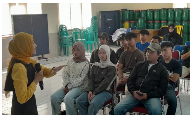
Gambar 1. Fasilitator memandu peserta dalam melakukan analisis SWOT.

Terakhir, Kelompok Threats menganalisis ancaman eksternal yang dapat menghambat kegiatan, meliputi bencana alam, premanisme, persaingan, dan dominasi pemodal besar. Temuan yang diperoleh dari analisis setiap kelompok berfungsi sebagai masukan penting dalam merumuskan rencana kegiatan, yang mencakup baik sasaran jangka pendek maupun jangka panjang.