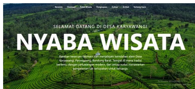
Gambar 4. Contoh pengisian informasi yang dilakukan oleh peserta.

Informasi mengenai Desa Wisata Karyawangi dapat diakses melalui laman https://wisata-desakaryawangi.id/ .