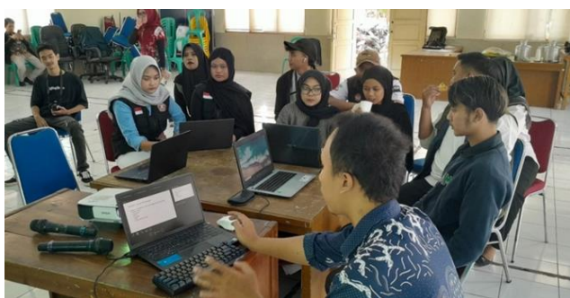
Gambar 3. Praktek memasukan data pada website Nyaba yang dipandu oleh tim.

berhasil menyajikan informasi mengenai potensi wisata yang ada di desa Karyawangi, fasilitas, dan kontak pengelola. Untuk mengisi data atau informasi pada fitur lainnya peserta harus mencari data terlebih dahulu sehingga diharapkan seluruh informasi berkaitan dengan pariwisata dapat dilihat oleh masyarakat atau wisatawan. Sebagai contoh implementasi praktis, visualisasi pengisian data ke dalam website Nyaba oleh peserta pelatihan disajikan dalam gambar berikut.