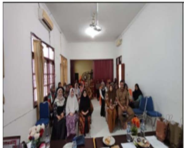
Gambar 5. Dokumentasi Setelah Kegiatan PKM

Informasi yang diperoleh dari beberapa peserta menyatakan bahwa menguatkan jiwa berwirausaha sangat penting, mereka ingin mengembangkan usahanya dan berprestasi. Peserta juga menyadari bahwa kegagalan dalam berusaha merupakan pengalaman belajar, tetap berwirausaha dan tidak mengulang yang salah. Peserta yang gagal berwirausaha berkomitmen untuk memulai lagi berusaha. Untuk bertahan hidup dan memperoleh keunggulan kompetitif pada usahanya, wirausahawan harus memiliki jiwa kewirausahaan, ini merupakan persyaratan penting bagi siapa pun yang memulai atau menjalankan bisnis. Menurut Pratama, G., & Elistia, E. (2020), menyatakan bahwa pengetahuan berwirausaha, motif berprestasi, kemandirian berusaha berpengaruh terhadap perilaku berwirausaha. Perilaku kewirausahaan dianggap sebagai salah satu faktor yang menentukan keberhasilan bisnis (Amarakoon & Teicher 2019) dan jiwa Kewirausahaan UMKM adalah jiwa tidak sendiri dan diperlukan, ditabur, dipupuk dari sejak dini untuk dapat dituai (Sinolungan, 2023). Pengusaha sukses adalah orang yang bertekad kuat, jeli melihat peluang, kreatif, inovatif, berkomitmen, dan berani mewujudkan idenya.