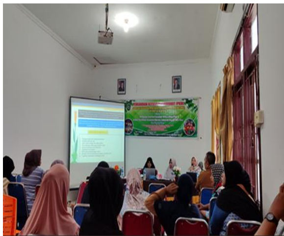
Gambar 1. Pemaparan Materi oleh Tim Pengabdian