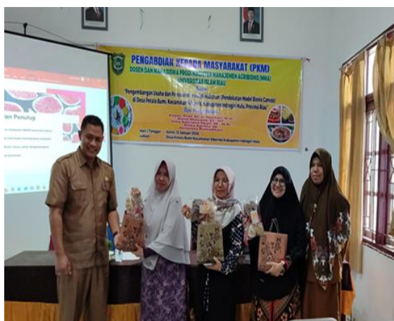
Gambar 2. Kepala Desa Memperlihatkan Produk UMKM

Pelaksanaan kegiatan pengabdian masyarakat ini mendapat respon positif dari peserta, hal ini nampak dari perhatiannya, menyimak ketika tim pengabdian memaparkan materi penyuluhan, dan pada sesi diskusi lebih dari 50% terlibat dalam diskusi.