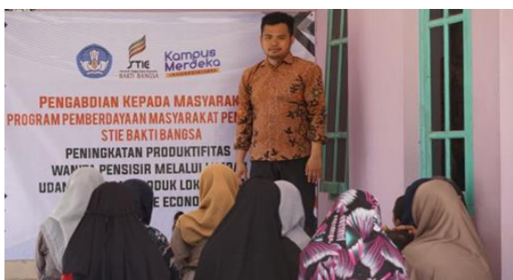
Gambar 1 Kegiatan Sosialisasi tentang Konsep Blue economy Kepada Mitra

Pelaksanaan kegiatan ini diawali dengan kegiatan sosialisasi kepada mitra agar mitra paham tentang konsep blue economy untuk peningkatan produktivitas wanita pesisir sebagai pelaku usaha di Wilayah Pesisir Desa Larangan Tokol Kec. Tlanakan Pamekasan ini. Sosialisasi berupa pemamparan materi kepada mitra terkait permasalahan yang dihadapi mitra yaitu aspek Produksi, tujuan, manfaat, dan jadwal kegiatan. Dengan adanya sosialisasi kepada mitra tujuan dari program pengabdian masyarakat pemula ini tersampaikan dengan baik dan dapat diserap oleh mitra karena setelah materi selesai dipaparkan, dilanjutkan dengan diskusi berupa tanya jawab antara pemateri dengan peserta. Diskusi dilakukan agar peserta lebih memahami materi yang telah disampaikan. Melalui diskusi, sosialisasi tidak hanya sekedar transfer knowledge saja melainkan dapat sharing pengalaman maupun permasalahan yang sedang dihadapi mitra. Sosialisasi ini dapat memberikan peningkatan pengetahuan dan pemahaman mitra tentang maksud dan tujuan dari pelaksanaan kegiatan PMP ini agar selanjutnya dapat diterapkan oleh mitra dengan baik. Serta konsep blue economy dapat diterapkan oleh mitra untuk peningkatan produktivitas wanita pesisir di Kecamatan Tlanakan meningkat. Kegiatan sosialisasi seperti pada Gambar 1