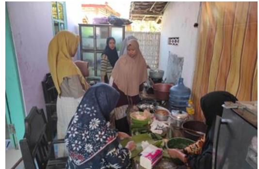
Gambar 2 Kegiatan Pelatihan

Kelompok usaha aeng out sebagai wanita pesisir setelah kegiatan ini terjadi peningkatan produktivitas dari segi produk yaitu ada penambahan macam produk yang bisa dijual dari diverifikasi produk dan pengolahan limbah udang yang awalnya hanya dijual mentah dengan adanya kegiatan ini tercipta beberapa produk olahan udang yang dihasilkan dari kegiatan pengabdian seperti pada gambar 3 yaitu: