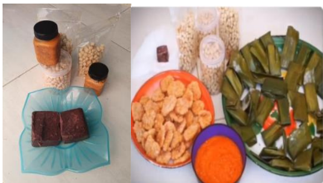
Gambar 3 Diverivikasi Produk Olahan Udang

Hal ini menunjukkan peningkatan produktivitas wanita pesisir dari kegiatan pelatihan limbah udang sebagai produk lokal dengan konsep blue economy . Selain itu ada penambahan output dari kegiatan pengabdian ini seperti pada tabel 3.