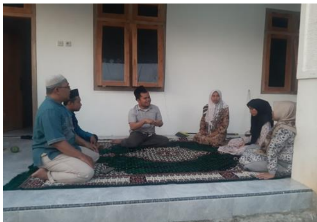
Gambar 4 Pendampingan dan Evaluasi Program

Selain itu juga pendampingan dan evaluasi dilakukan untuk mengetahui kemampuan keterampilan mitra baik dalam menejemen atau proses produksi olahan udang berbahan limbah udang. Evaluasi ini dilakukan dengan cara membandingkan kondisi mitra sebelum program dilaksanakan dan kondisi mitra setelah program dilaksanakan. Adapun hasil evaluasi seperti pada gambar 5 :