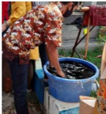
Gambar 1. Proses perendaman batik

Tidak semua limbah dibuang melalui saluran air, ada juga yang ditampung dalam bak penampungan untuk diendapkan malamnya. Seperti pada Gambar 1. mitra menampung sisa limbah kain hasil pencelupan kain batik saat proses pewarnaan.