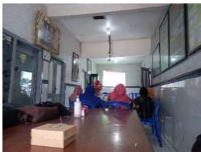
Gambar 3. Materi perancangan alat pengolah limbah

Sebelum memberikan materi mengenai bahaya limbah, mitra diberikan pertanyaan – pertanyaan awal mengenai pengetahuan mereka mengenai limbah. Dari hasil yang didapatkan yaitu semuanya tahu bahwa limbah itu berbahaya namun tetap saja membuang limbah sisa pembuatan batik ini ke sungai. Menurut mitra hal tersebut dilakukan karena belum adanya solusi dan ketidaktahuan mitra