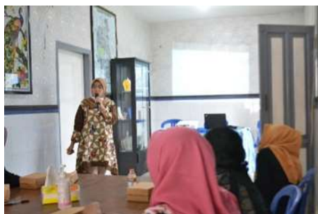
Gambar 2. Materi bahaya limbah cair batik

Menjawab permasalahan kurangnya pemahaman pelaku UMKM Omah Batik Sukun ini terhadap dampak negatif pembuangan limbah batik secara langsung ke sungai maka solusi untuk permasalahan ini adalah melakukan penyuluhan tentang bahaya limbah. Penyuluhan ini dilakukan selama 2 kali dengan jumlah peserta sebanyak 10 orang yang merupakan anggota dari pokdarwis di RW 03 yang membentuk UMKM Omah Batik Sukun.