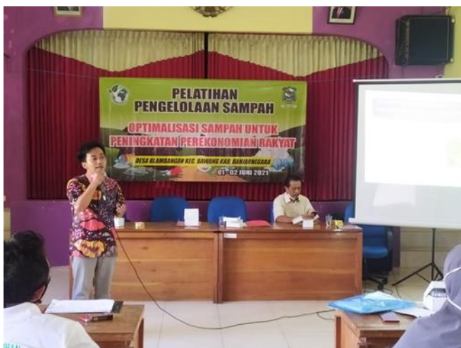
Gambar 2. Teori tentang biopestisida disampaikan narasumber kepada peserta.

penekanan intensitas serangan penyakit sebesar 50,69%. Hal ini disebabkan oleh peranan keberadaan mikroba yang terdapat dalam biopestisida.