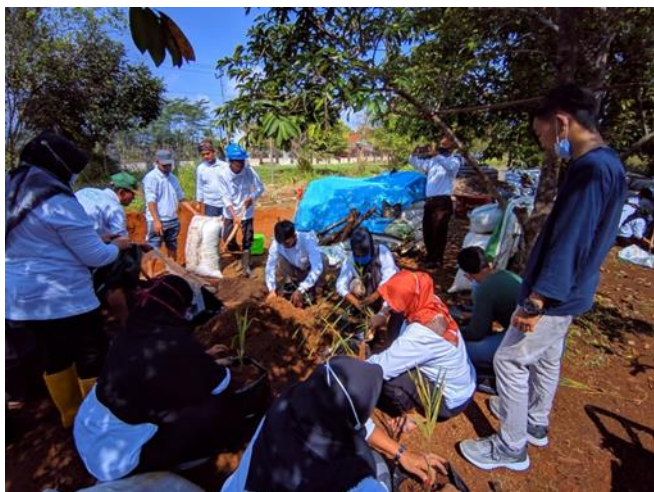
Gambar 3. Praktik aplikasi biopestisida pada tanaman jahe.

Tindak lanjut dari materi yang sudah disampaikan kepada peserta yaitu praktik aplikasi biopestisida. Peserta melakukan praktik aplikasi biopestisida untuk pengayaan media tanam. Media tanam yang sudah disaiapkan berupa tanah dan pupuk kandang dengan perbandingan 1 : 1. Media tanam dimasukkan ke polibag ukuran diameter 40 cm, selanjutnya pada lubang tanam yang telah disiapkan ditambahkan 5 g biopestisida (bahan aktif Trichoderma sp. ) Biopestisida dilakukan pengadukan yang merata pada lubang tanam. Selanjutnya bibit jahe siap untuk dimasukkan ke dalam polibag. Prayogo & Bayu, (2020), biopestisida yang diaplikasikan secara preventif dan terintegrasi berpotensi sebagai inovasi teknologi pengendalian hama untuk menggantikan pestisida sintetik. Triasih et al., (2019) menjelaskan bahwa penggunaan biopestisida ini dapat menghasilkan produk pertanian yang berkualitas, aman, murah, dan sehat.