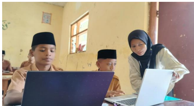
Gambar 4. Pendampingan dan Pelatihan

Selain pemaparan materi kami juga melakukan praktik, pendampingan, dan pelatihan kepada siswa mengenai Microsoft Office.