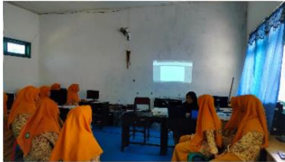
Gambar 3. Penyampaian Materi dan Pengenalan Komputer

Selanjutnya yaitu penyampaian materi dan pengenalan komputer kepada siswa MTs Bustanul Ulum Sumber Anom, mulai dari pengertian komputer, bagian-bagian komputer dan fungsinya seperti CPU, Monitor, Keyboard, Mouse, Printer, dan juga Laptop sebagai contoh perkembangan dari komputer. Adapun siswa yang terlibat dalam kegiatan pengabdian ini yaitu siswa kelas 7, 8, dan 9 dengan total keseluruhan sekitar 120 siswa dengan pembagian jadwal yang sudah ditentukan. Pendampingan dan pelatihan Microsoft office ini dilaksanakan selama 4 kali pertemuan setiap kelas, dimana setiap pertemuan waktunya adalah satu jam. Dengan begitu kami menggunakan bantuan modul proyektor dan laptop. Melalui bantuan tersebut dapat membuat penyampaian materi jadi lebih efisien. Materi yang kami paparkan juga disesuaikan dengan kebutuhan siswa yakni mengenai Microsoft Office seperti Ms. Word, Ms. Excel dan Ms. PowerPoint.