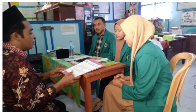
Gambar 2. Observasi dan Wawancara

Kegiatan pengabdian kepada masyarakat dilaksanakan selama satu bulan dimulai pada 03 Januari 2024 sampai 03 Februari 2024. Kegiatan ini berupa pemberian pendampingan dan pelatihan Microsoft Office yaitu Ms. Word, Ms. Excel, dan Ms. PowerPoint kepada siswa MTs Bustanul Ulum Sumber Anom. Kegiatan pendampingan dan pelatihan ini dilakukan secara offline di kelas dan laboratorium komputer sekolah.