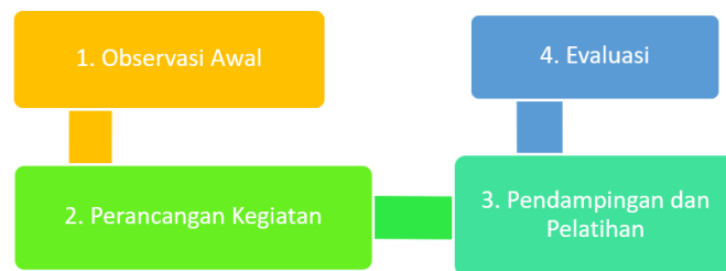
Gambar 1. Tahapan Kegiatan

Berdasarkan Gambar 1 tentang tahapan kegiatan, berikut penjelasan beberapa tahapan-tahapan yang dilakukan antara lain: