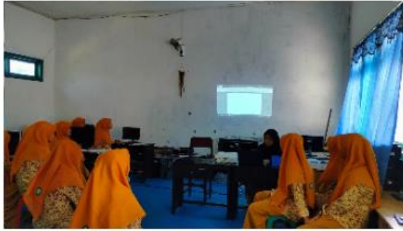
Gambar 3. Penyampaian Materi dan Pengenalan Komputer

Selanjutnya yaitu penyampaian materi dan pengenalan komputer kepada siswa MTs Bustanul Ulum Sumber Anom, mulai dari pengertian komputer, bagian-bagian komputer dan fungsinya seperti CPU, Monitor, Keyboard, Mouse, Printer, dan juga Laptop sebagai contoh perkembangan dari komputer. Adapun siswa yang terlibat dalam kegiatan pengabdian ini yaitu siswa kelas 7, 8, dan 9 dengan total keseluruhan sekitar 120 siswa dengan pembagian jadwal yang sudah ditentukan. Pendampingan dan pelatihan Microsoft office ini dilaksanakan selama 4 kali pertemuan setiap kelas, dimana setiap pertemuan waktunya adalah satu jam. Dengan begitu kami menggunakan bantuan modul proyektor dan laptop. Melalui bantuan tersebut dapat membuat penyampaian materi jadi lebih efisien. Materi yang kami paparkan juga disesuaikan dengan kebutuhan siswa yakni mengenai Microsoft Office seperti Ms. Word, Ms. Excel dan Ms. PowerPoint.