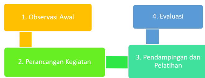
Gambar 1. Tahapan Kegiatan

Berdasarkan Gambar 1 tentang tahapan kegiatan, berikut penjelasan beberapa tahapan-tahapan yang dilakukan antara lain: