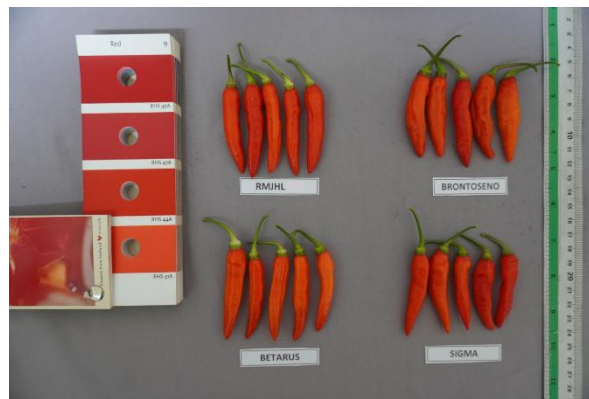
Gambar 5. Karakter warna buah tua keempat varietas yang diuji.