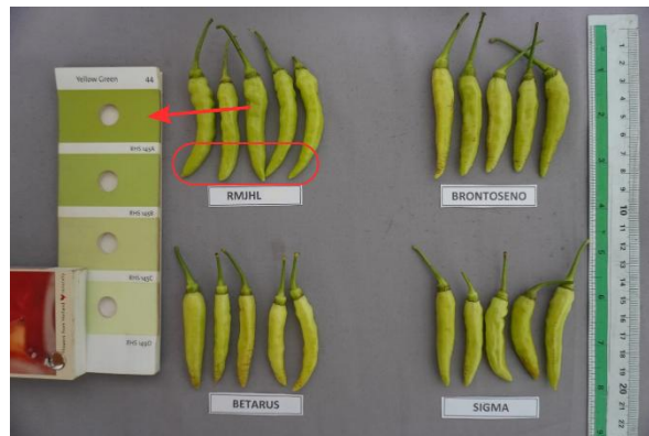
Gambar 4. Penciri utama pada warna buah muda dan bercak bergaris pada ujung buah.