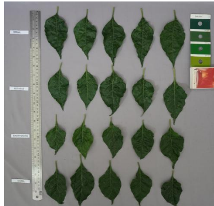
Gambar 1. Karakter daun keempat varietas cabai rawit

Hasil tersebut sesuai dengan penelitian Nazari et al. (2023) yang menyatakan bahwa karakter morfologi daun, khususnya bentuk ujung daun, merupakan indikator penting dalam identifikasi varietas karena bersifat stabil dan mudah diamati. Penelitian Tripodi & Greco (2018) juga menjelaskan bahwa karakter vegetatif tanaman cabai memiliki peran penting dalam karakterisasi plasma nutfah dan identifikasi varietas pada program pemuliaan. Hal ini juga diperkuat oleh Undang-Undang Nomor 29 Tahun 2000 yang menyatakan bahwa karakter khusus yang mampu membedakan suatu varietas dari varietas lain dapat digunakan sebagai penciri utama varietas.