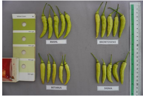
Gambar 5. Karakter buah muda keempat varietas cabai rawit.