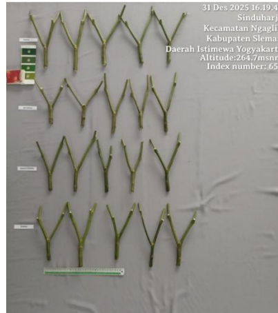
Gambar 1. Karakter batang keempat varietas cabai rawit.