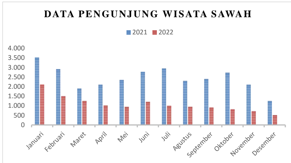
Gambar 1. Data pengunjung wisata sawah

Berdasarkan data diatas terlihat bahwa Pengunjung mengalami penurunan yang signifikan dari tahun 2021 ke tahun 2022, penurunan Pengunjung ini di sebabkan beberapa faktor. Salah satunya adalah faktor tidak adanya pembaharuan Wisata Sawah, karena dengan adanya pembaruan Wisata Sawah akan memajukan dan meningkatkan objek wisata, agar objek wisata tersebut menjadi lebih baik dan membuat ketertarikan wisatawan untuk mengunjungi. Berdasarkan uraian tersebut maka penulis begitu tertarik untuk melakukan penelitian dengan judul “Strategi Pengembangan Desa Wisata Dalam Meningkatkan Daya Tarik Wisatawan di Desa Bajang Kecamatan Pakong Kabupaten Pamekasan”. Tujuan dalam penelitian ini yaitu untuk mengetahui potensi dan strategi pengembangan desa wisata dalam meningkatkan daya tarik wisatawan pada wisata sawah di Desa Bajang Kecamatan Pakong Kabupaten Pamekasan.